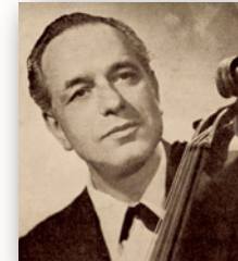
Gaspar Cassadó (1897-1966) Suite para violoncello solo